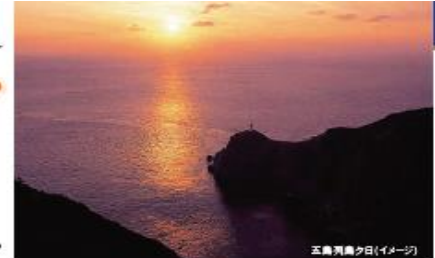
五島列島夕日(イメージ)